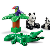
いろんなどうぶつ