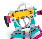
小学校高学年・中学校・高校