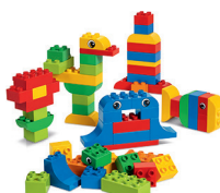
デュプロ®はじめてのブロックセット