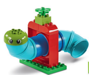
ゆかいなチューブ