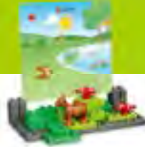
デュプロ。おはなし 作りセット レッスン数:8 生徒4人まで