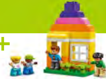
みんなのビッグ ワールド レッスン数:8 生徒10人まで