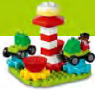
デュプロ。くるくる ゆうえんちセット レッスン数:8 生徒8人まで

STEAM (Science, Technology, Engineering, Arts, Math) と社会性の発達