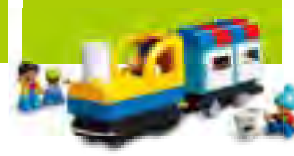
デュプロ。プログラ ミングトレイン レッスン数:8 生徒6人まで