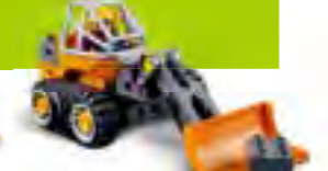
デュプロ。楽しいテッ クマシーンセット レッスン数:8 生徒6人まで