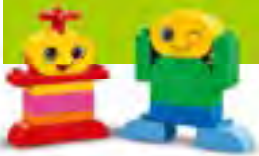
デュプロ。みんなの きもちセット レッスン数:12 生徒6人まで